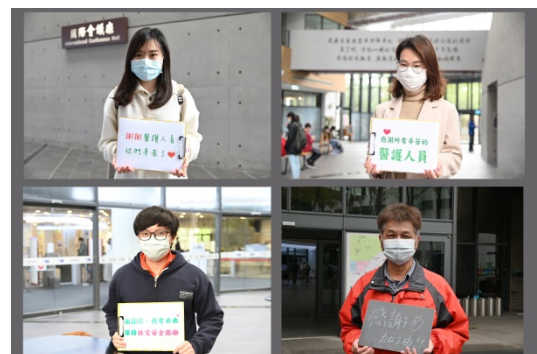
許多清華師生參與向醫護致敬短片拍攝