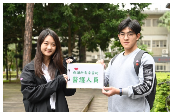
許多清華師生參與向醫護致敬短片拍攝