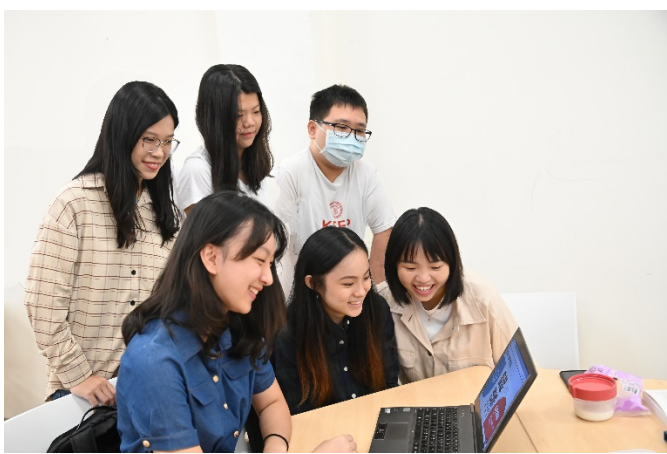
選修「疫災下的人性反思」課程的學生課堂討論