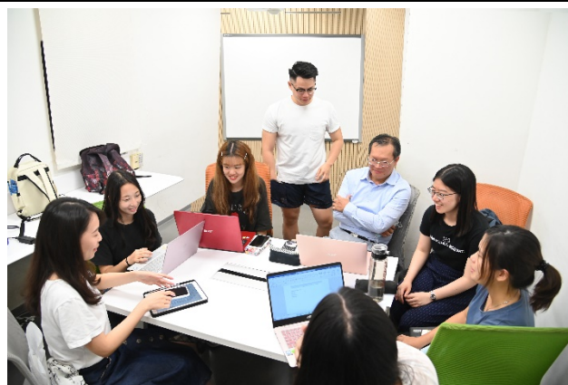
本校7位外語、人社、經濟系學生申請自主學習計畫，自行規畫「後疫情時代的全球秩序變遷」課程