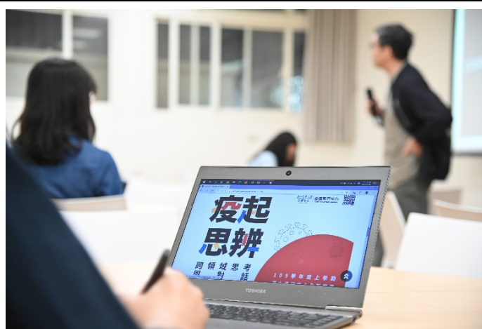
本校本學期開設「疫起思辨:跨領域思考與對話」微學分通識課程