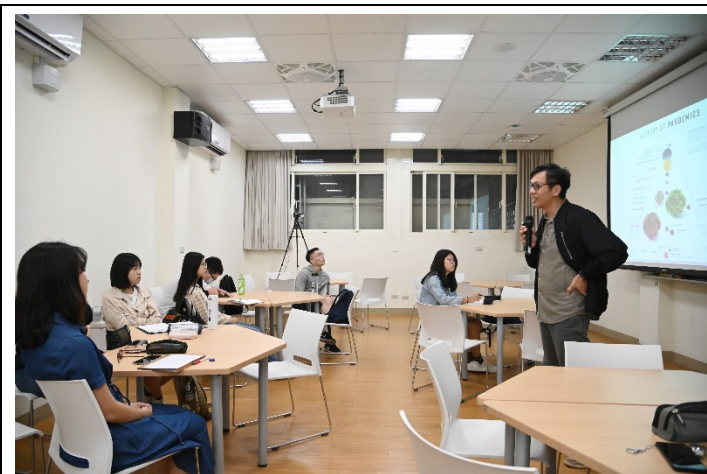
「疫災下的人性反思」課程很受學生歡迎