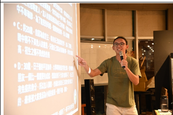
選修「進階編劇」的學生構思以疫情為主題的劇本角色