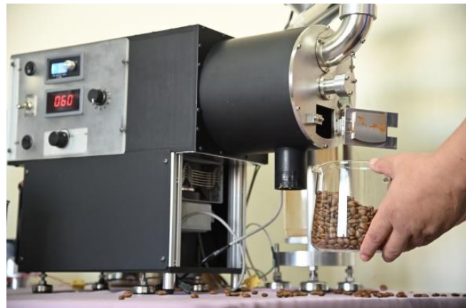
清華研發全球第一台「微波烘豆機」，省時又省電。