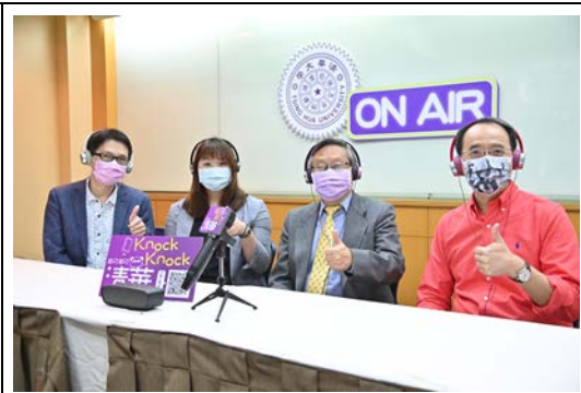
清華大學錄製 Podcast 節目「那可那可清華」幫高中生敲開認識大學的門。右起清華大學教務長焦傳金、清華大學校長賀陳弘、清華大學招生策略中心主任王潔、清華大學中文系副教授羅仕龍。