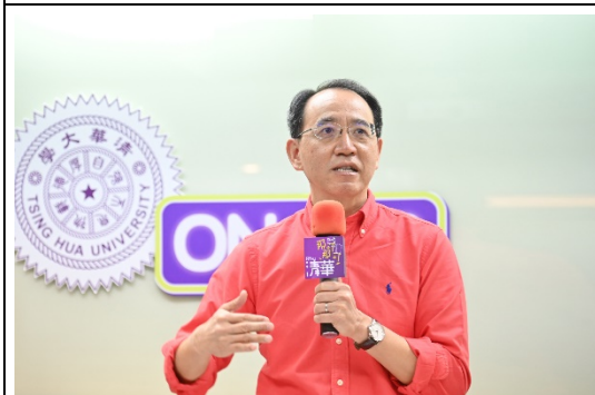
清華大學教務長焦傳金介紹專為高中生打造的 Podcast 節目