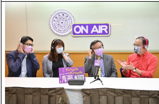
清華大學錄製 Podcast 節目「那可那可清華」幫高中生敲開認識大學的門。右起清華大學教務長焦傳金、清華大學校長賀陳弘、清華大學招生策略中心主任王潔、清華大學中文系副教授羅仕龍。