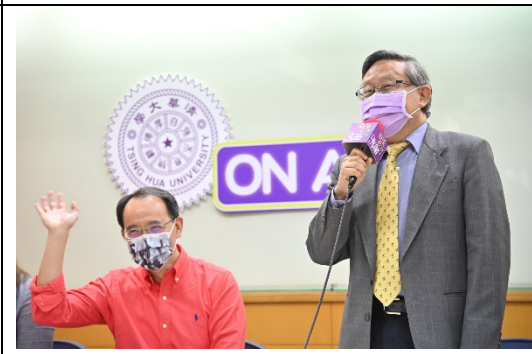
清華大學校長賀陳弘(右)介紹專為高中生打造的 Podcast 開播