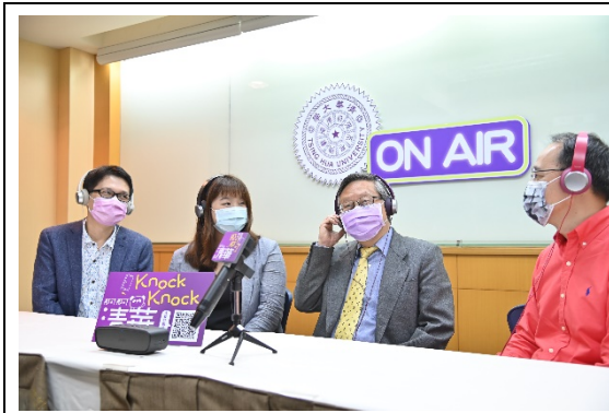
清華大學錄製 Podcast 節目「那可那可清華」幫高中生敲開認識大學的門。右起清華大學教務長焦傳金、清華大學校長賀陳弘、清華大學招生策略中心主任王潔、清華大學中文系副教授羅仕龍。