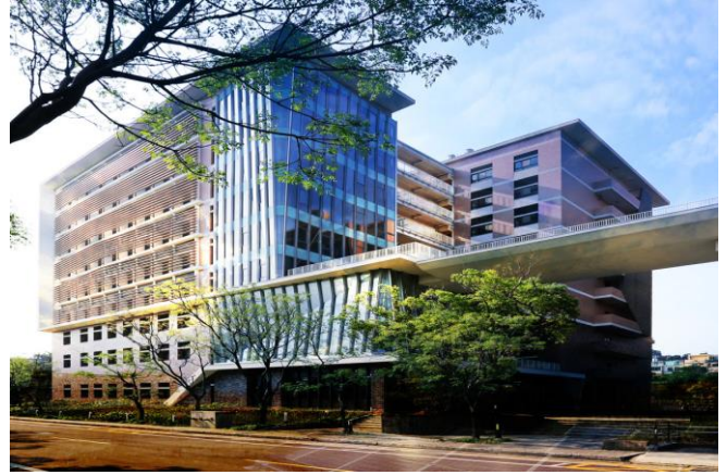
清華大學半導體學院預計 8 月成立