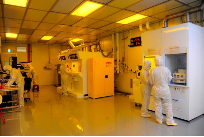
清華半導體學院學生未來將可在黃光實驗室內上實驗課