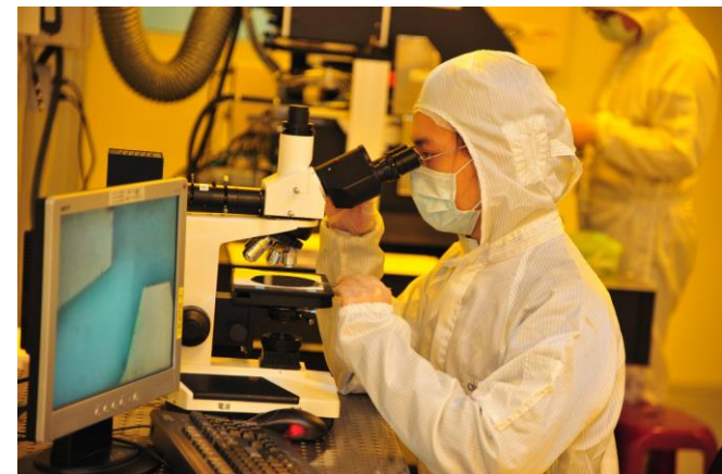
清華半導體學院學生未來將可在黃光實驗室內上實驗課，用顯微鏡觀測曝光顯影結果