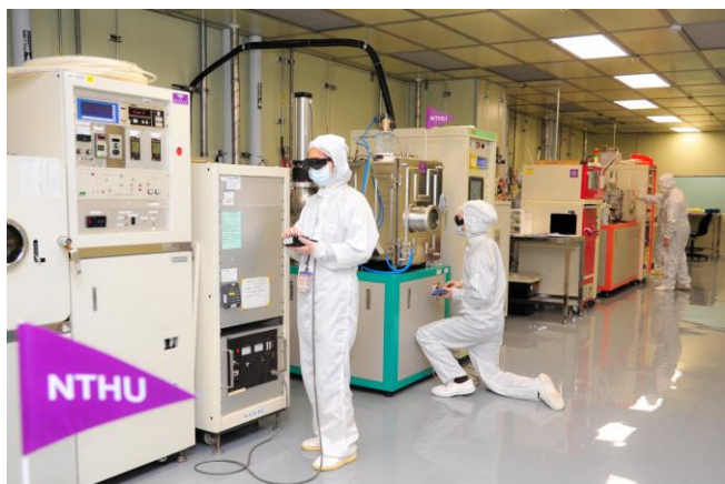
清華半導體學院學生未來將可進入無塵室體驗、學習先進的製程技術