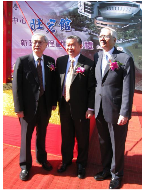
旺宏捐助清華 4 億元興設「學習資源中心—旺宏館」，並於劉炯朗前校長（右）任內開始籌建，這個金額在當時打破了企業捐助單一大學的最高紀錄，傳為美談