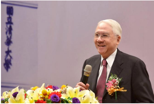
劉炯朗前校長待人親切、笑語如珠，深受學生愛戴