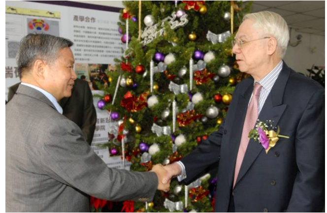
劉炯朗前校長（右）與旺宏電子吳敏求董事長（左） 2009 年在清華旺宏圖書館上樑典禮握手慶賀