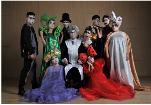
本校音樂系公演歌劇音樂會《薩勒姆風暴》