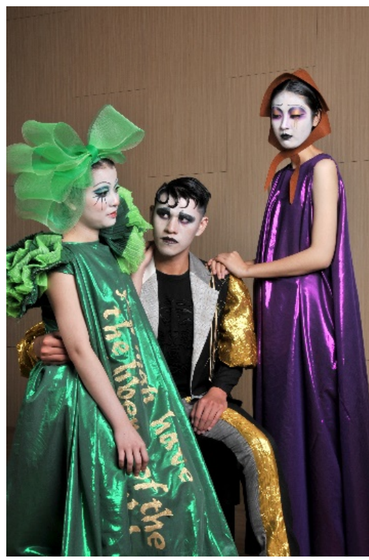
主角之一的農夫約翰周旋在妻子與情婦之間