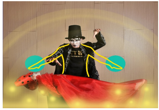
電腦視覺即時骨架與動作捕捉系統偵測到驅魔師的施咒手勢，即時產生特效