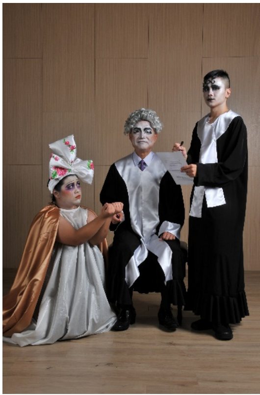
法官兼執政官維護虛偽的法律表象，禁錮人心