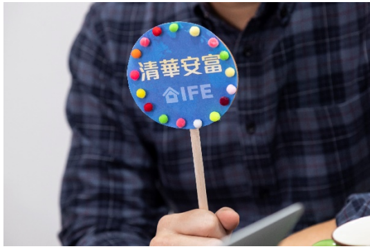
清華「安富財經科普系列」11月25日在 YouTube 開播