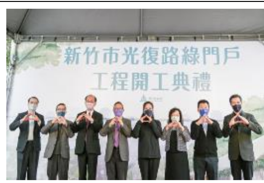
光復路綠門戶計畫開工。