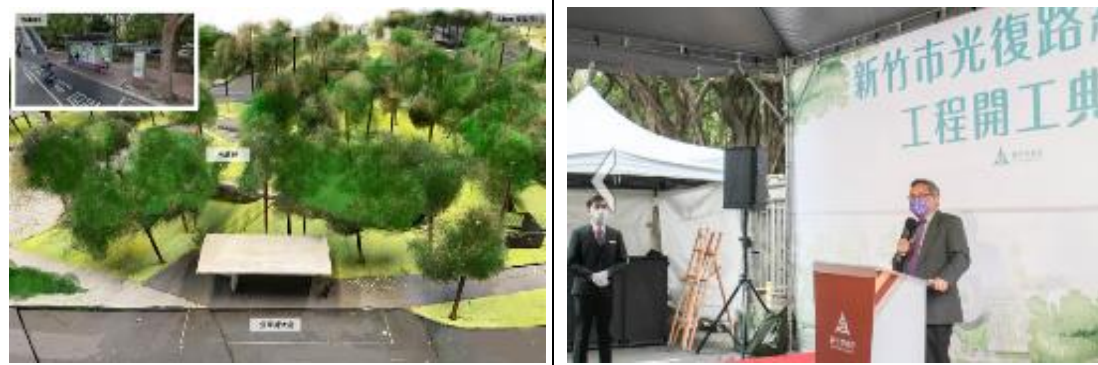
未來的市區公車站與清華山丘規劃的模型。左上角為現況。