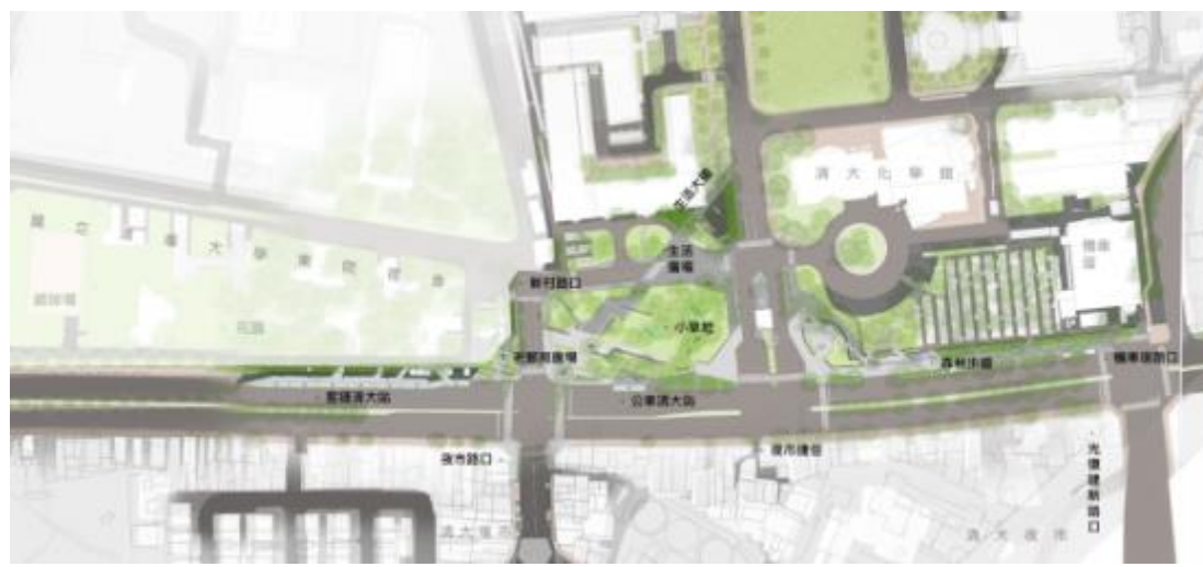
光復路綠門戶計畫俯視圖。