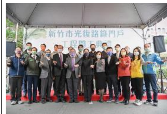
光復路綠門戶計畫開工。