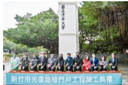
新竹市政府安排敲磚儀式，宣告光復路綠門戶計畫開工。