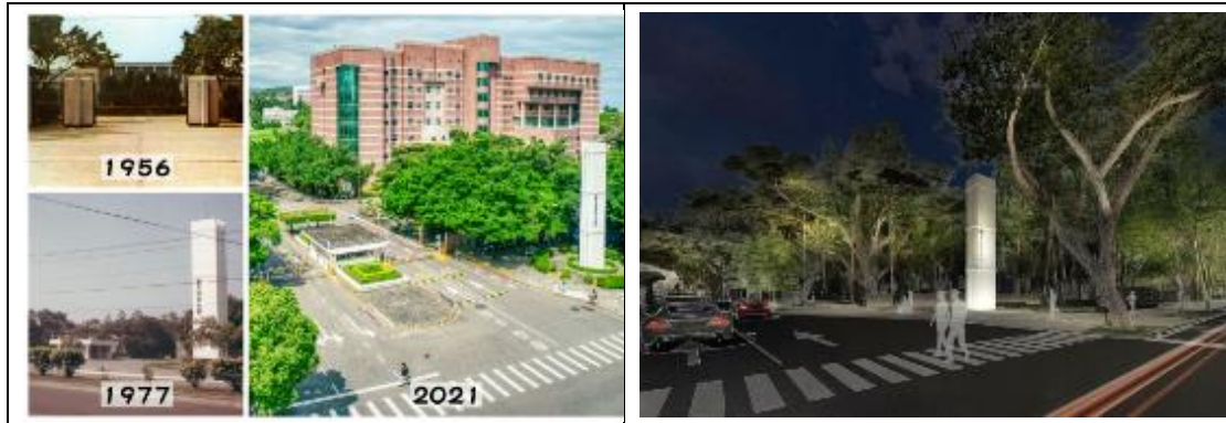
清華在台建校後的校門變化。