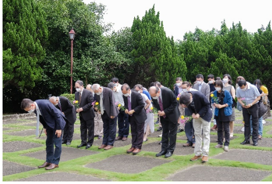
高為元校長帶領師生向梅貽琦校長鞠躬致意。