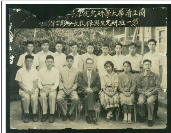
梅貽琦校長(前排中)與清華第一班研究生合影。