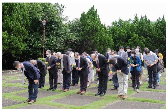
高為元校長帶領師生向梅貽琦校長鞠躬致敬。