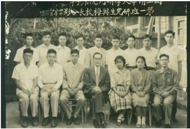
梅貽琦校長(前排中)與清華第一班研究生合影。