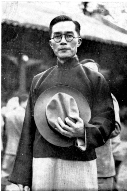
清華在台建校校長梅貽琦風骨令人景仰。