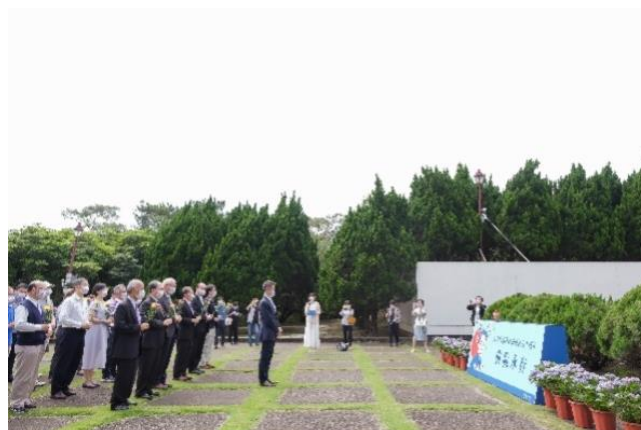
本校 5 月 19 日紀念梅貽琦校長逝世 60 周年。