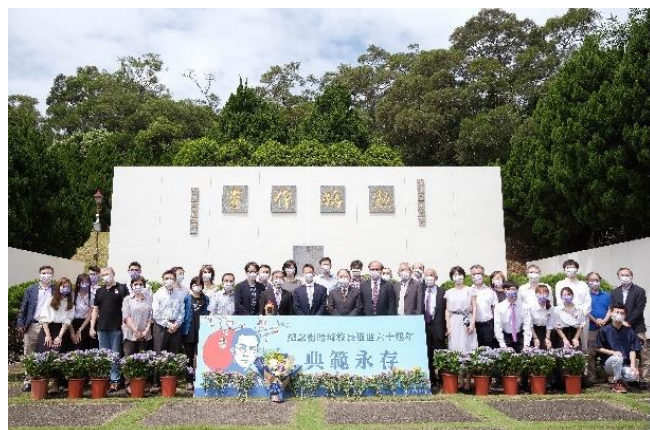
本校 5 月 19 日紀念梅貽琦校長逝世 60 周年。

領清華不斷進步的精神致敬。戴念華副校長、陳信文副校長、林聖芬副校長，及清華百人會段定夫會長也都出席了這次的祭梅典禮。