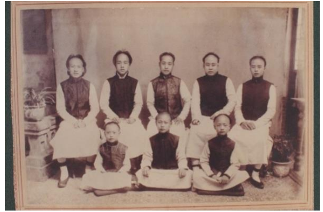
梅貽琦校長(後排右一)為庚子賠款獎學金的第一批清華赴美留學生。