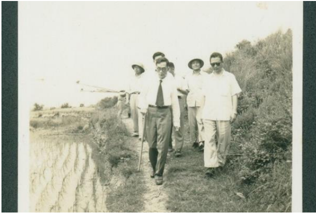
梅貽琦校長(左)1957年視察位於新竹赤土崎的清華大學預定校地。