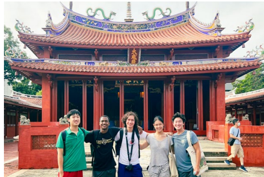
優華語學生參訪台南孔廟。