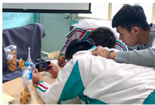
台科大師生教花蓮玉里高中學生為行銷小農果乾拍攝照片。