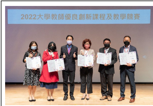
清華巫勇賢教務長（左三）頒獎表揚「大學教師優良創新課程及教學競賽」優等得主。