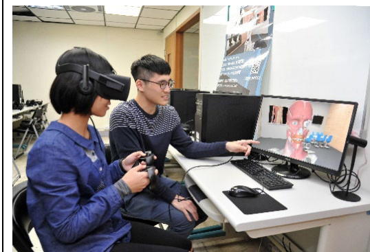
清華醫科系引進 VR 虛擬實境人體解剖系統。