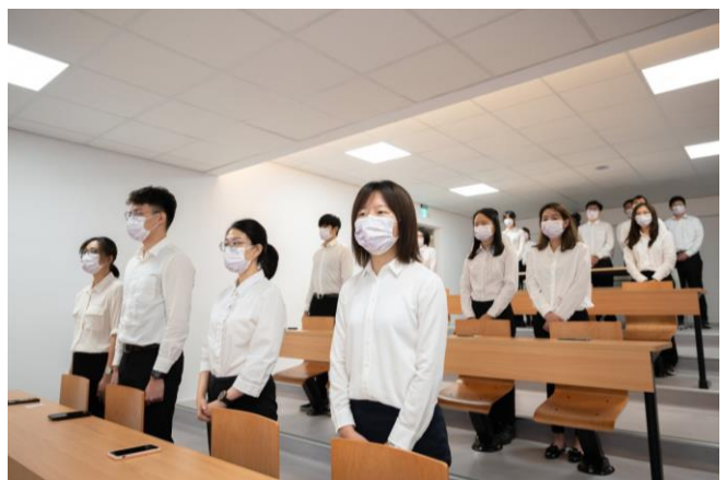
本校學士後醫學系學生合唱「感恩的心」，表達對大體老師的感恩。