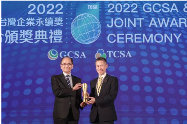
本校高為元校長（右）從游錫堃立法院長手中接過「台灣永續典範大學獎」首獎獎座。