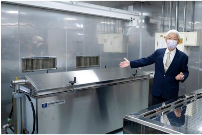
本校購置近 3 百萬元的全自動防腐機，將大體防腐時間縮短為 1 個月。