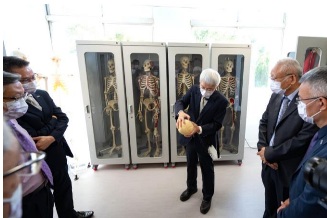
本校購入真人全身骨骼標本與可分解真人頭顱標本，供解剖課使用。