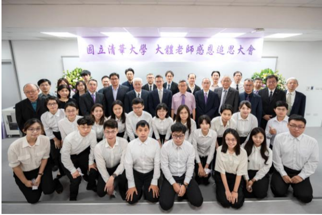
本校師生參與大體老師感恩追思大會。