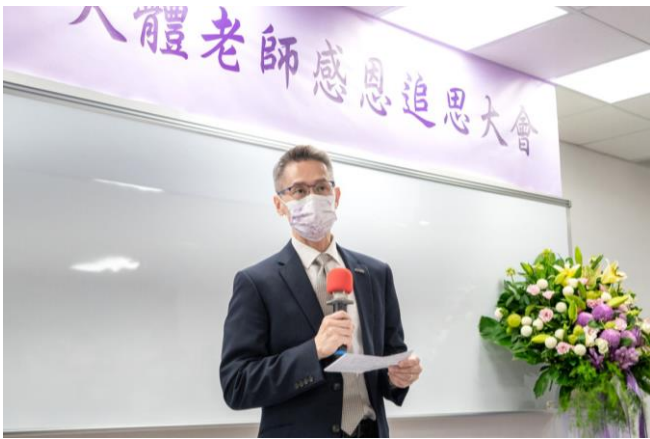
本校高為元校長代表學校感激每一位大體老師的無私與大愛。