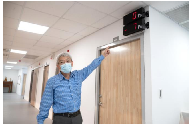
解剖實驗室與獻體室全日維持負壓狀態，福馬林味道不外溢。