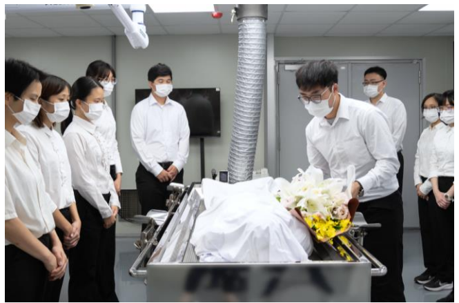
本校學士後醫學系學生在第一堂解剖課前向大體老師獻花。