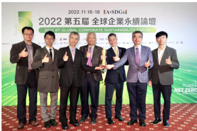
本校包括學生代表在內的永續團隊榮獲「台灣永續典範大學獎」首獎。