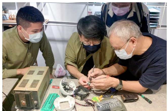
本校學生團隊「維修聊天室」鼓勵大家把壞掉的小家電等用品拿來維修更新。