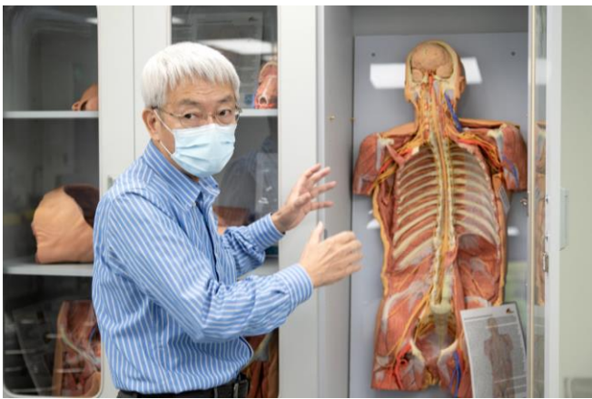
本校購入 3D 列印塑膠擬真標本模型。