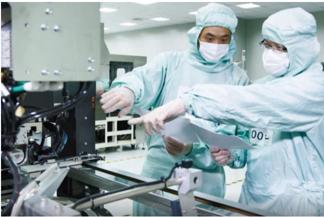
均華精密是台灣在地自主研发的半導體封裝設備供應商。