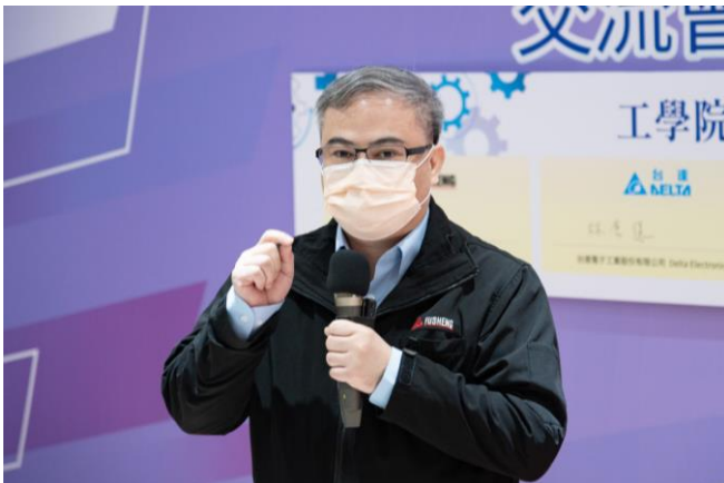
復盛集團歐信昌人資長表示公司在全球布局，員工有跨領域與跨國外派的多元選擇。