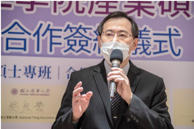
均華精密石敦智總經理表示，研發人才是企業發展的核心。