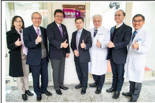
設於北榮新竹分院的清華醫學堂12月15日揭牌。