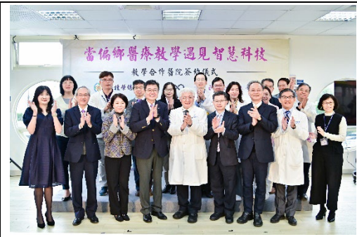
長期深耕偏鄉醫療的北榮新竹分院與本校簽約，正式成為清華學士後醫學系的教學合作醫院。