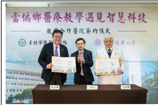
長期深耕偏鄉醫療的北榮新竹分院與本校簽約，正式成為清華學士後醫學系的教學合作醫院。