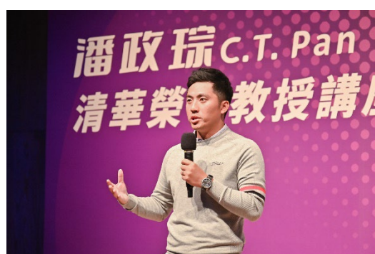
潘政琮與學生分享投身高球運動的心路歷程。