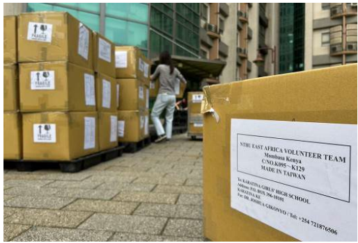
本校國際志工團整理二手電腦並裝箱，先海運送往肯亞