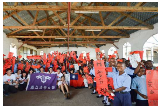
本校國際志工團曾在坦尚尼亞舉辦寫春聯活動