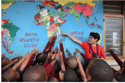
本校國際志工團與坦尚尼亞學童互動