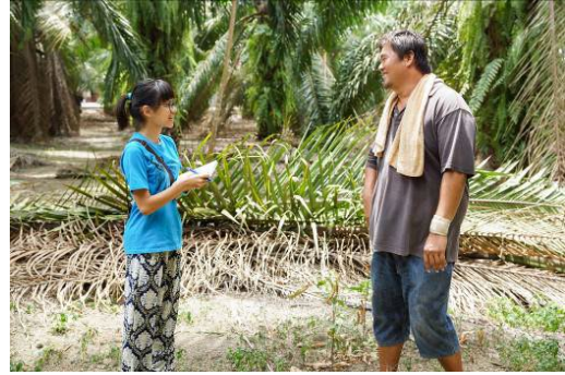
本校國際志工團有前往馬來西亞田野調查的豐富經驗