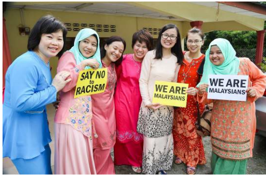
本校國際志工紀錄馬來西亞開齋節時提倡多元共榮的時刻