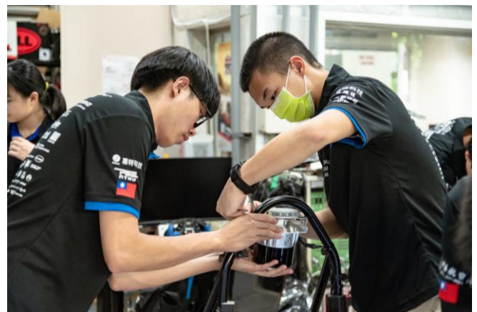
清大賽車工廠在第七代賽車上加裝包含光學雷達的無人駕駛系統