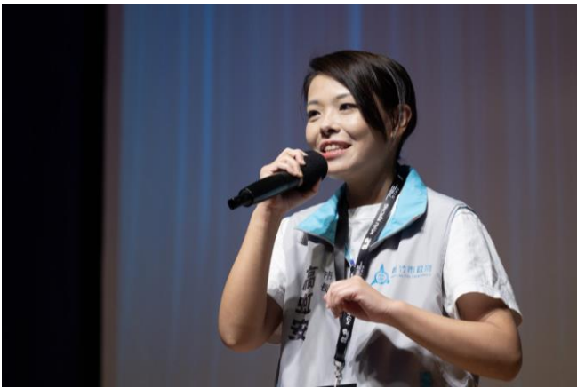
新竹市高虹安市長說清華同學帶著賽車登上國際舞台，令她非常感動