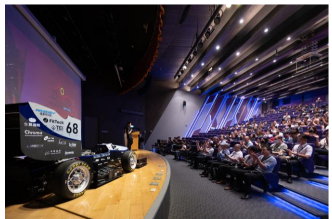
清大賽車工廠第七代學生方程式賽車「TH07」首度亮相