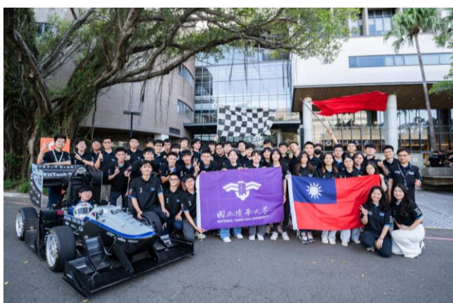
清大賽車工廠第七代無人駕駛電動賽車 21 日正式亮相

清大賽車工廠團隊目前有 70 人，成員來自動機、電機、物理、經濟、化工、工工、工科等系，從大一學生到碩二生都有，由林昭安與王培仁教授共同指導。