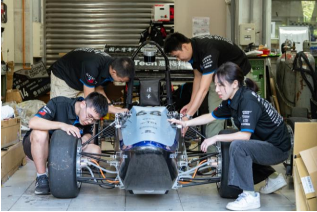
清大賽車工廠花了 10 月打造第七代無人駕駛電動賽車