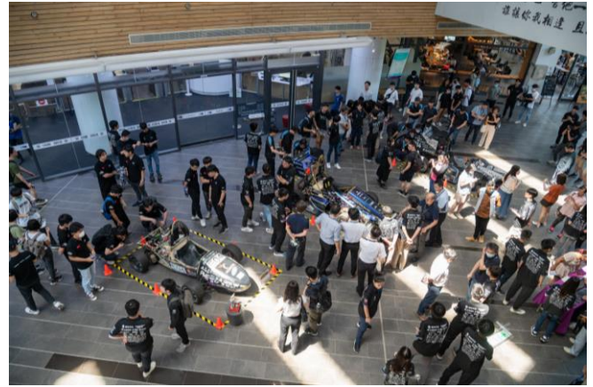
清大賽車工廠第七代無人駕駛電動賽車 21 日正式亮相