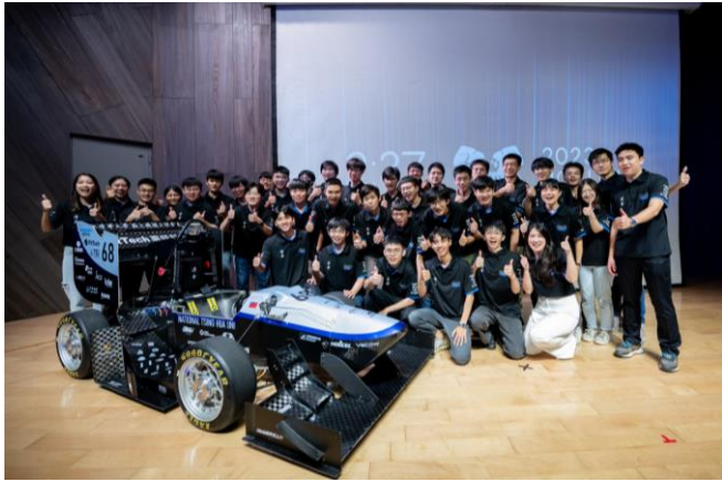
清大賽車工廠第七代無人駕駛電動賽車 21 日正式亮相