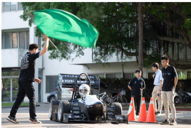
清大賽車工廠第七代學生方程式賽車「TH07」首度亮相