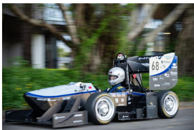
清大賽車工廠第七代無人駕駛電動賽車 21 日正式亮相