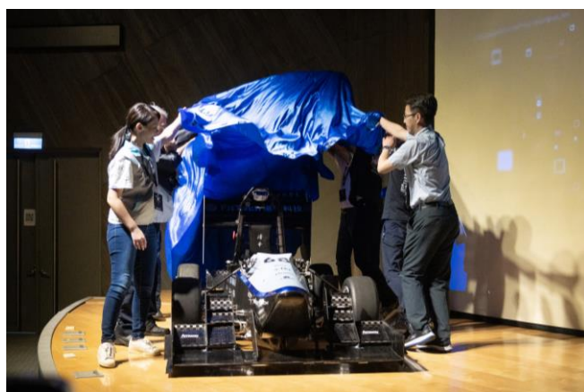
本校戴念華副校長、新竹市高虹安市長 21 日與賽車工廠團隊拉開第七代賽車的布幕