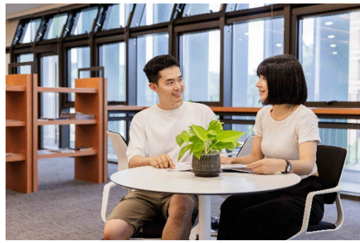
學士後醫學系第二屆新生今天開學。