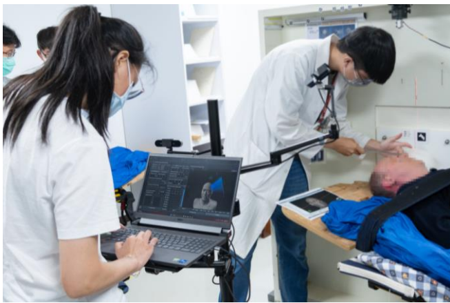
醫師調整腦癌病患接受中子束照射的位置。