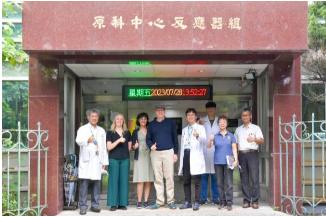
罹患腦癌的瑞士作家耶格在本校接受硼中子捕獲治療後，與妻女及治療團隊合影。