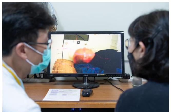
醫師及家屬透過螢幕掌握照射室內的病患狀況。