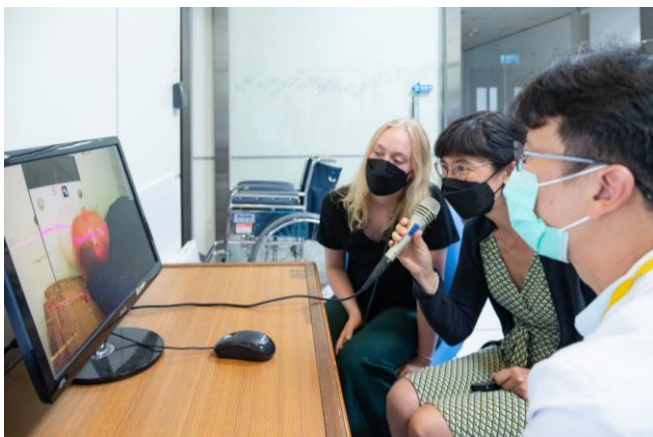
瑞士作家耶格接受中子束照射時，妻女在外面透過麥克風對話，為他打氣。