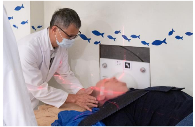
罹患腦癌的瑞士作家耶格在清華硼中子捕獲治療中心接受中子束照射。