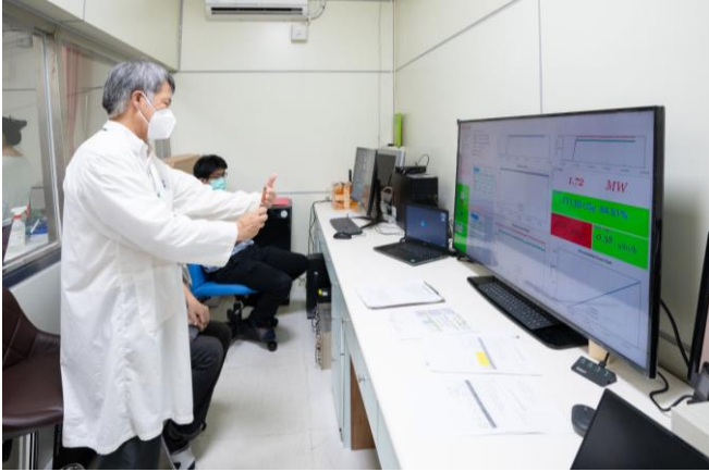
本校團隊在硼中子捕獲治療控制室掌握中子束照射劑量。