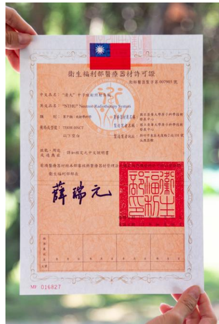
「清大中子放射照射系統」取得衛福部頒發的醫療器材許可證。