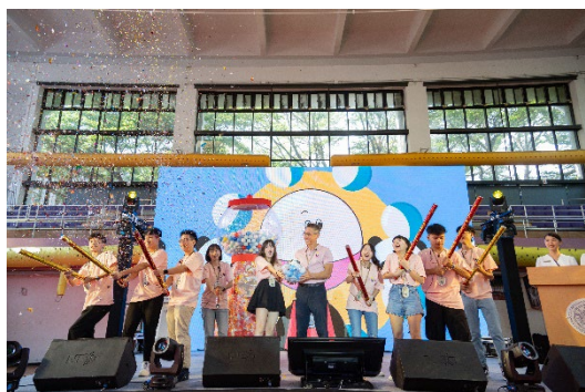
本校新生領航營拉開序幕。

為鼓勵學生用餐時自備環保餐具，校內的小吃部、水木餐廳及風雲樓餐廳各商家都推出不少優惠，自備餐具可折價 2 到 5 元。在調查住宿生意見時，不少人希望保鮮餐盒可微波或裝熱湯，因此這次送給新生的保鮮盒特別選用耐熱玻璃材質，並分為大小兩種容量可供新生選擇。