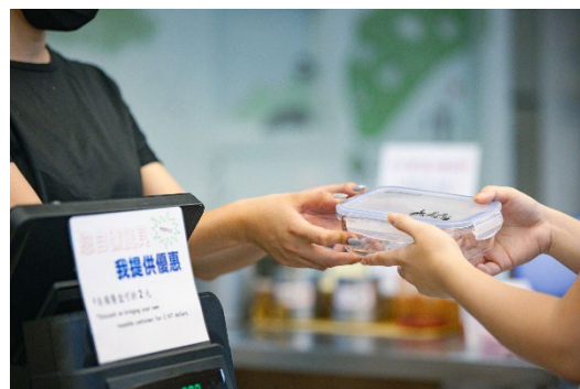
清華校內餐廳提供自備餐具的師生折