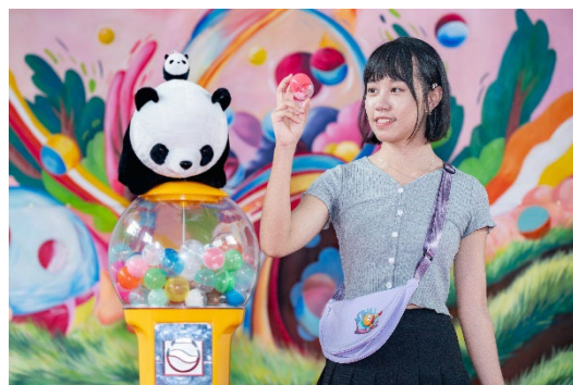
清華新生完成破冰活動後，就可以獲得一枚扭蛋，兌換束口袋、T恤等為新生設計的紀念品。