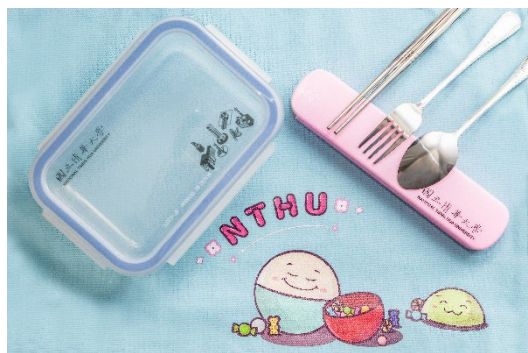
本校送給每位新生一組環保餐具。