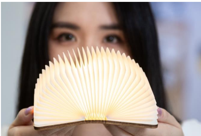
數位圖書館開幕有獎徵答活動贈送書本燈。