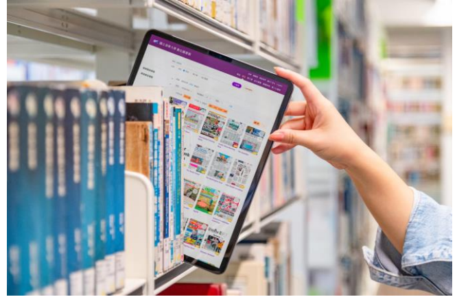
本校推出全國第一座大學數位圖書館，百萬館藏隨身帶著走。