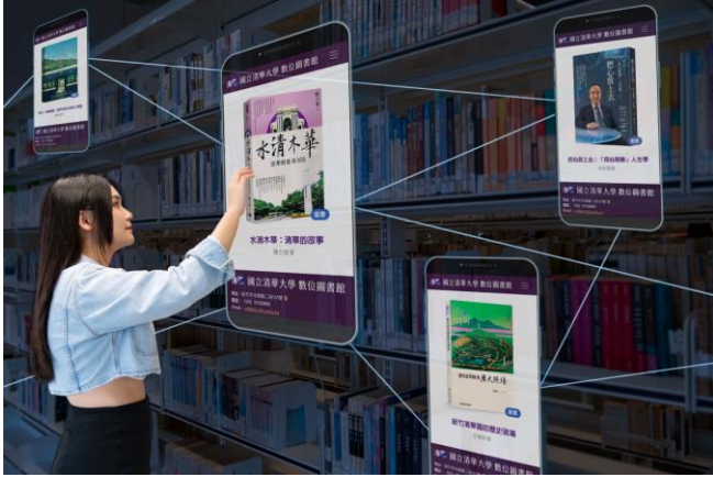
本校推出全國第一座大學數位圖書館。