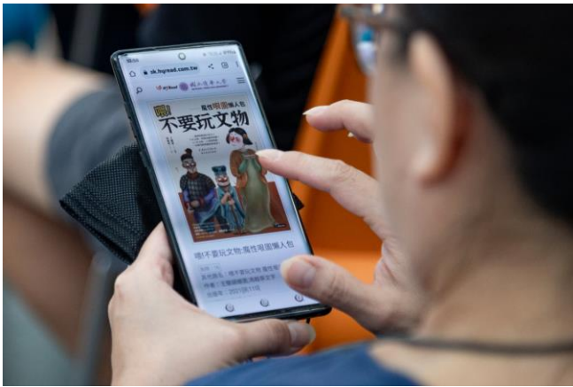
本校師生拿起手機登入數位圖書館。