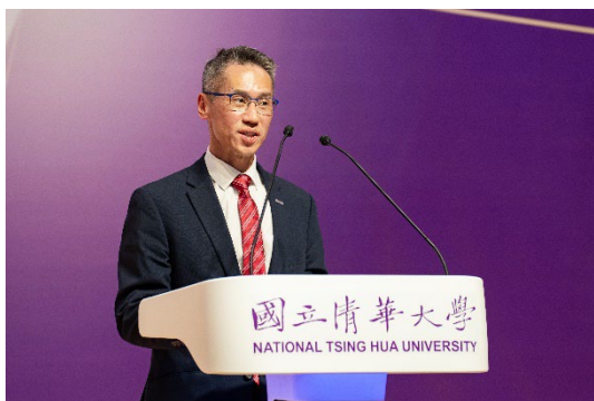
本校高為元校長表示，今年校慶主軸「清華新能量」，希望引進更多校友及社會大眾的力量，轉動並激發出一股新能量。