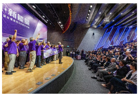
1974年畢業校友帶領全場重呼當年梅竹賽的隊呼「清華加油！我是清華！我們是清華！」