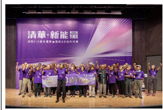
1974年畢業校友帶領全場重呼當年梅竹賽的隊呼「清華加油！我是清華！我們是清華！」